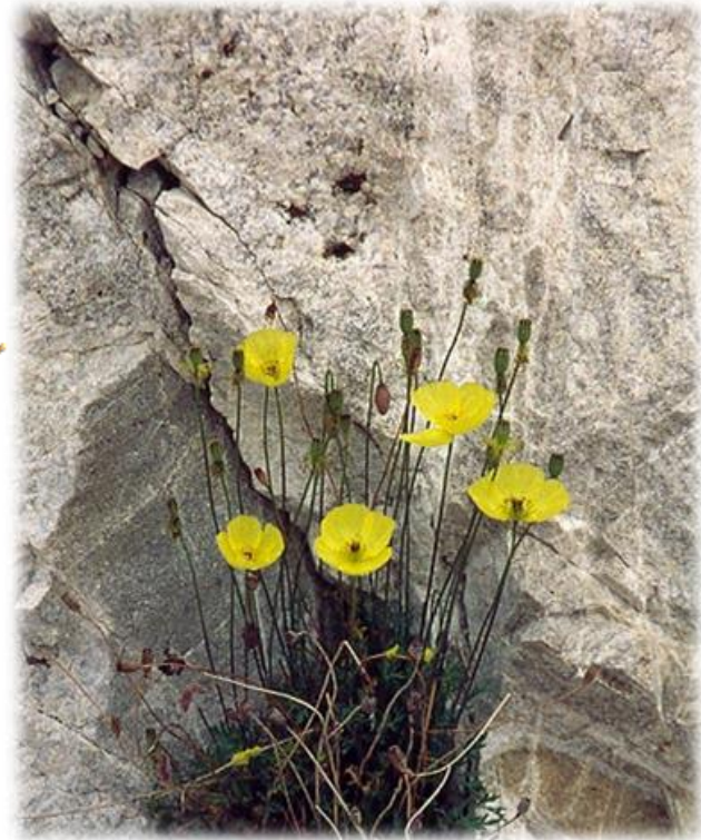
маки на байкальских скалах